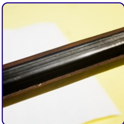
Prima della brunitura

Le illustrazioni seguenti mostrano un esempio tipico: La brunitura Black Magic da Tifoo è ottima per riparare delle parti deteriorate su armi. Nell'esempio abbiamo riparato una parte molto deteriorata di una canna di fucile.