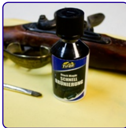
Brunitura Black Magic da Tifoo

Le illustrazioni seguenti mostrano un esempio tipico: La brunitura Black Magic da Tifoo è ottima per riparare delle parti deteriorate su armi. Nell'esempio abbiamo riparato una parte molto deteriorata di una canna di fucile.