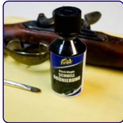
Black Magic Brünierung Tifoo

Die folgenden Bilder zeigen ein typisches Beispiel: Die Tifoo Black Magic Brünierung kann hervorragend für die Ausbesserung von beschädigten Stellen auf Waffen herangezogen werden. Im Beispiel wurde eine stark abgenutzte Stelle eines Gewehrlaufs restauriert.