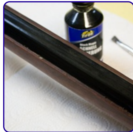
Nach der Neu-Brünierung